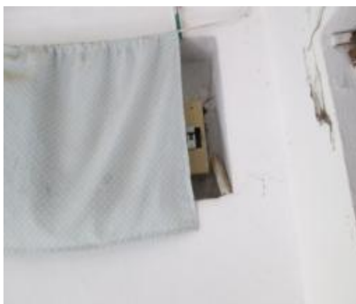
תמונה 2 : אולם הגן